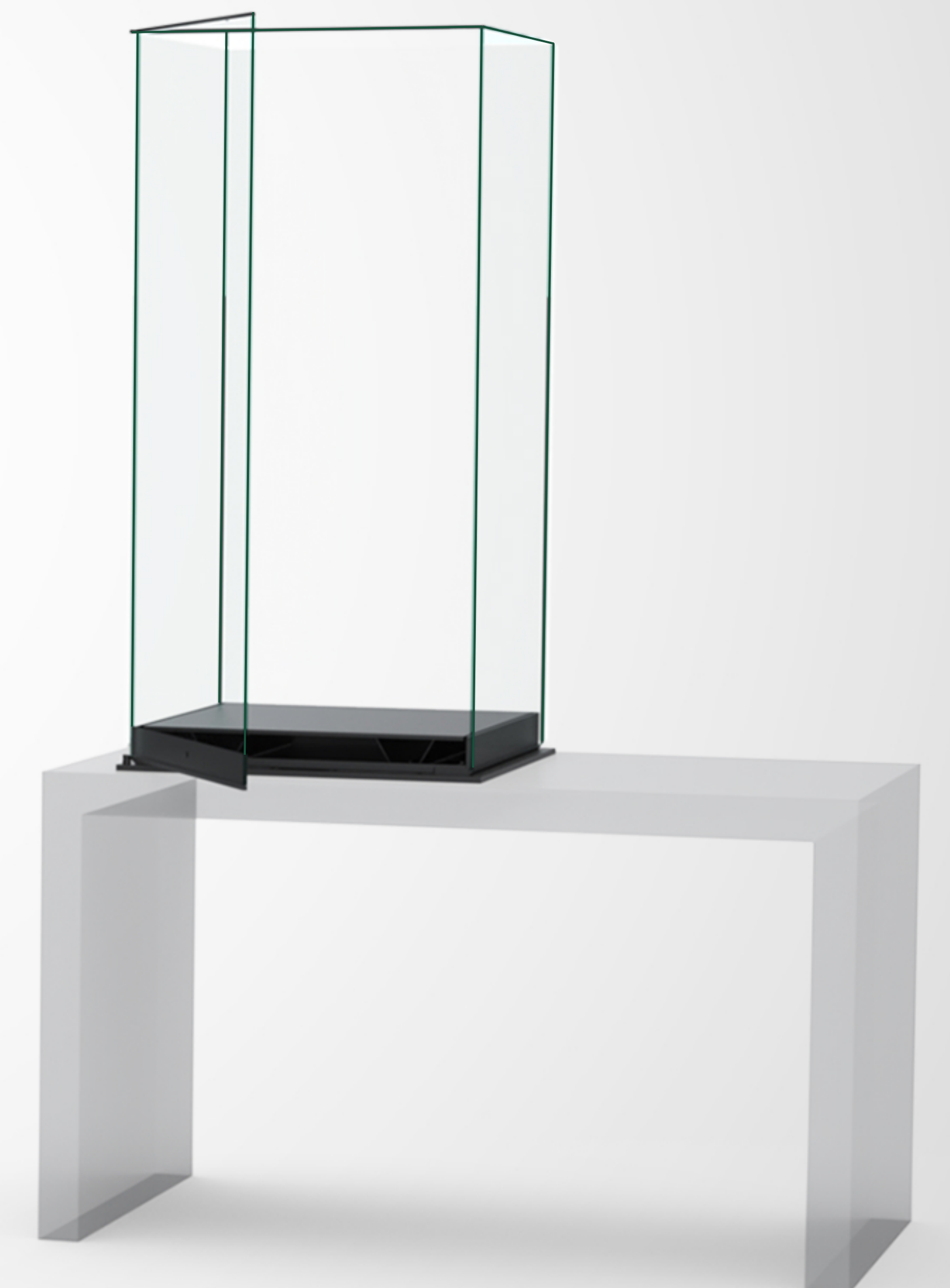
Modèle de base (Comptoir)

Base avec revêtement en poudre / Couleur noire standard / Verre laminé UV régulier / Ouverture à pivot facile / Enveloppe d'art étanche / Compartiment de contrôle de l'humidité sous le plateau de présentation.